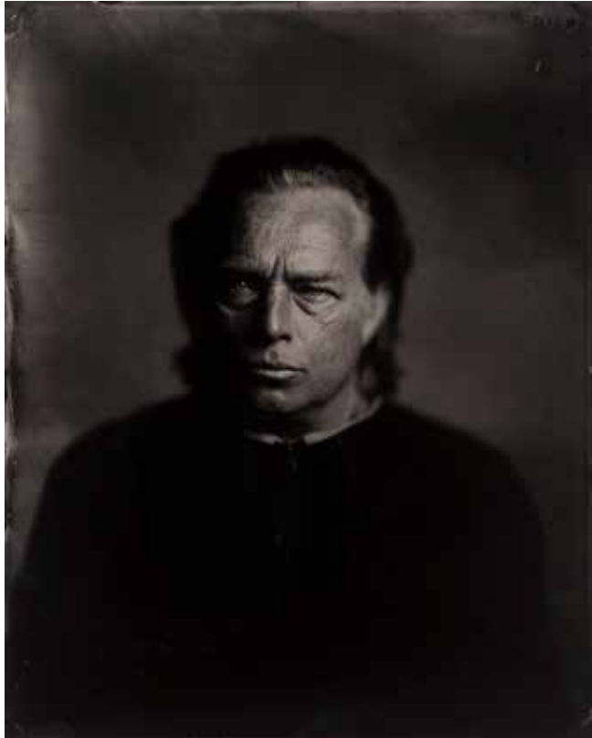
© Hans de Kort / Koos Breukel